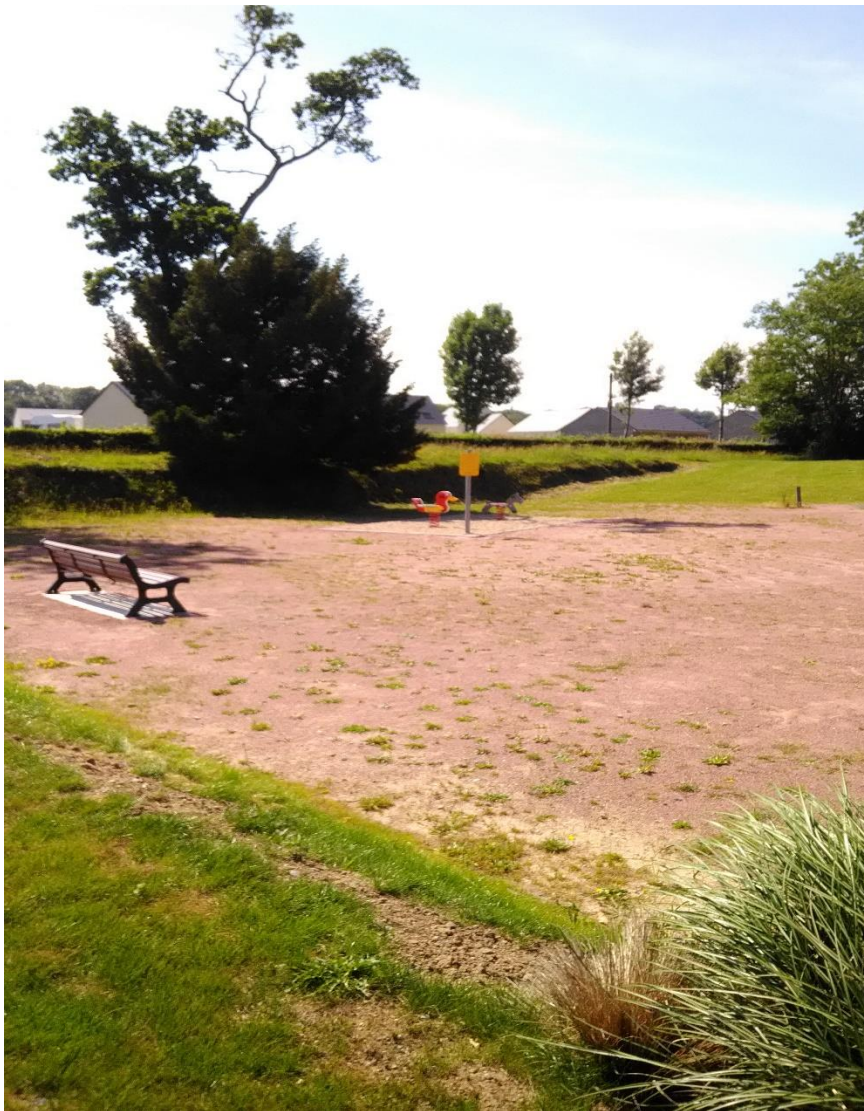
Aménagement aire de jeux multisports

La pose de 2 jeux à ressorts a été réalisée par nos agents communaux.