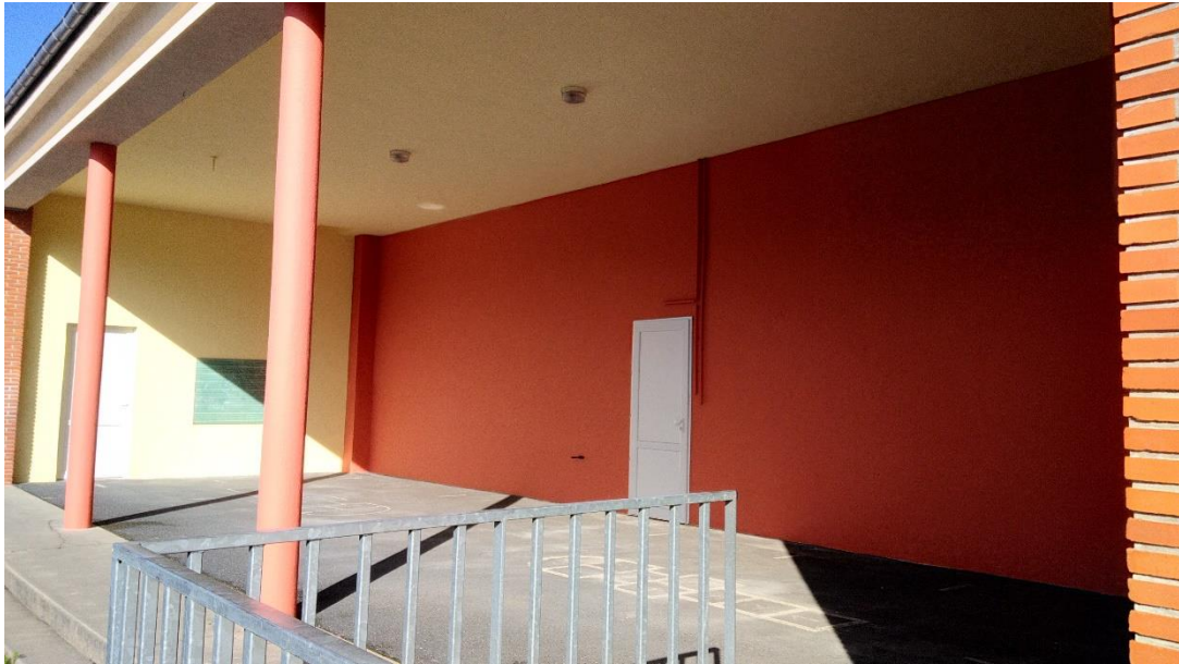
Travaux d'embellissement du préau par la SARL Julien Chardin pour un montant de 2138,40€ TTC