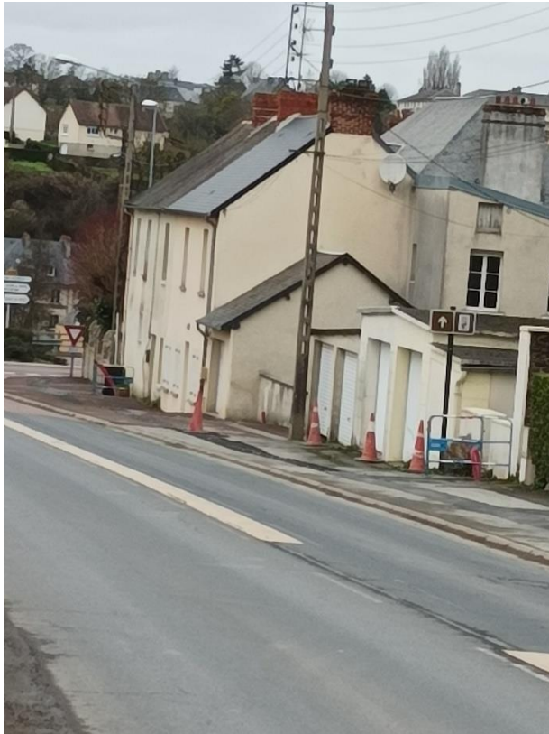
Route de St Lô avant travaux d'effacement

Travaux d'effacement de réseaux pour un montant de 90803,19€ HT avec un restant à charge de la commune de 22366,69€ HT