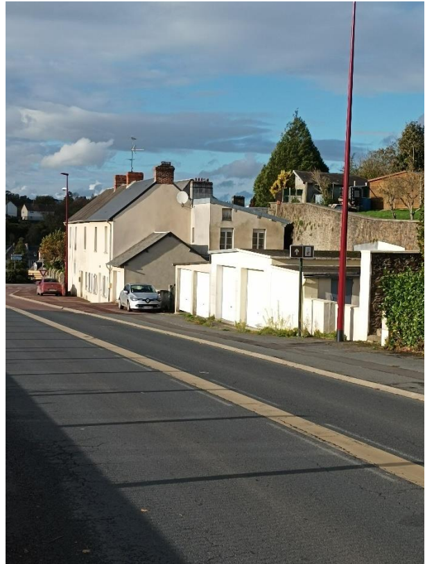
Route de St Lô après travaux d'effacement