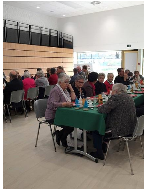
une partie des convives prêts pour le repas offert par le club

Nos dernières activités avaient permis de réunir la majorité des adhérents, le repas de Noël le dimanche 15 décembre 2019, la galette des rois le jeudi 9 janvier 2020 et la séance théâtrale du dimanche 23 février 2020.