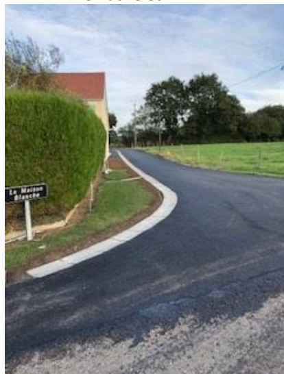
La Maison Blanche