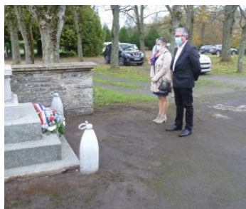
Cérémonie en petit comité pour cause de pandémie