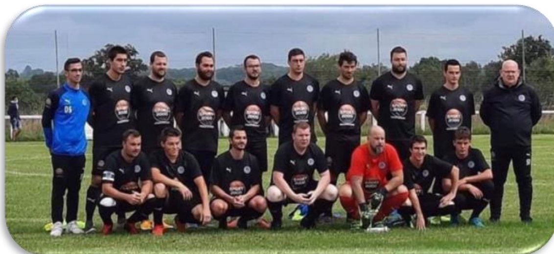
Photo d'équipe lors de notre victoire en tour préliminaire de Coupe de France le 30 août dernier. Match contre Le Lorey, équipe jouant une division au-dessus de nous

Suite au confinement qui a été acté fin octobre, nos compétitions ont été à nouveau arrêtées, c'est pourquoi nous ne vous proposons pas l'agenda des matchs comme nous l'avions fait dans ce bulletin l'an dernier, car il va évidemment subir de nombreux bouleversements. Nous sommes très contents de voir quelquefois des habitants de la commune venir nous soutenir, et nous vous invitons à composer le numéro contact si vous souhaitez connaître les dates des matchs au stade de La Meauffe.